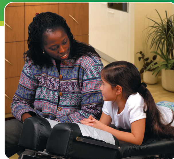
Se sabe que el cuidado quiropráctico mejora el comportamiento y la salud emocional de los niños.

Si su hijo está sufriendo de cualquiera de las siguientes afecciones, es esencial que se haga un examen de columna