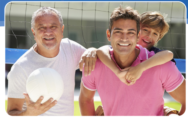
Las víctimas de latigazo pueden tener estrés, irritación o lesión en los nervios.